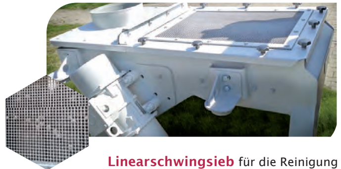
Linearschwingsieb für die Reinigung von Kaffee mit schnelldemontierbarer Sieb-kassette und Kugelklopfvorrichtung