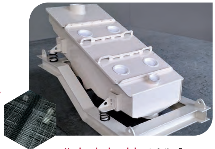
Kreisschwingsieb mit Seilauflhängung für die Tierfutterindustrie mit längsgespanntem Sieb-gewebe und Kugelklopfvorrichtung

Ihre Aufgabenstellung - unsere Lösung für Sie