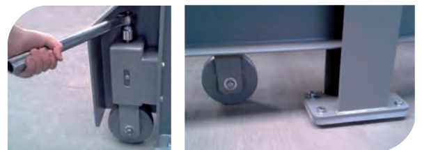
Die manuell ausfahrbaren Verfahrrollen erleichtern die schnelle Wartung außerhalb der Schallschutzkabine.